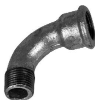
CURVA 90° MF BEND 90° MF