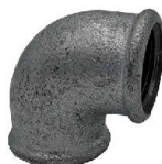
GOMITO 90° FF ELBOW 90° FF