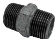
NIPLO DOPPIO HEXAGON NIPPLE