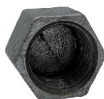
TAPPO F CAP F