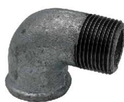
GOMITO 90° MF ELBOW 90° MF